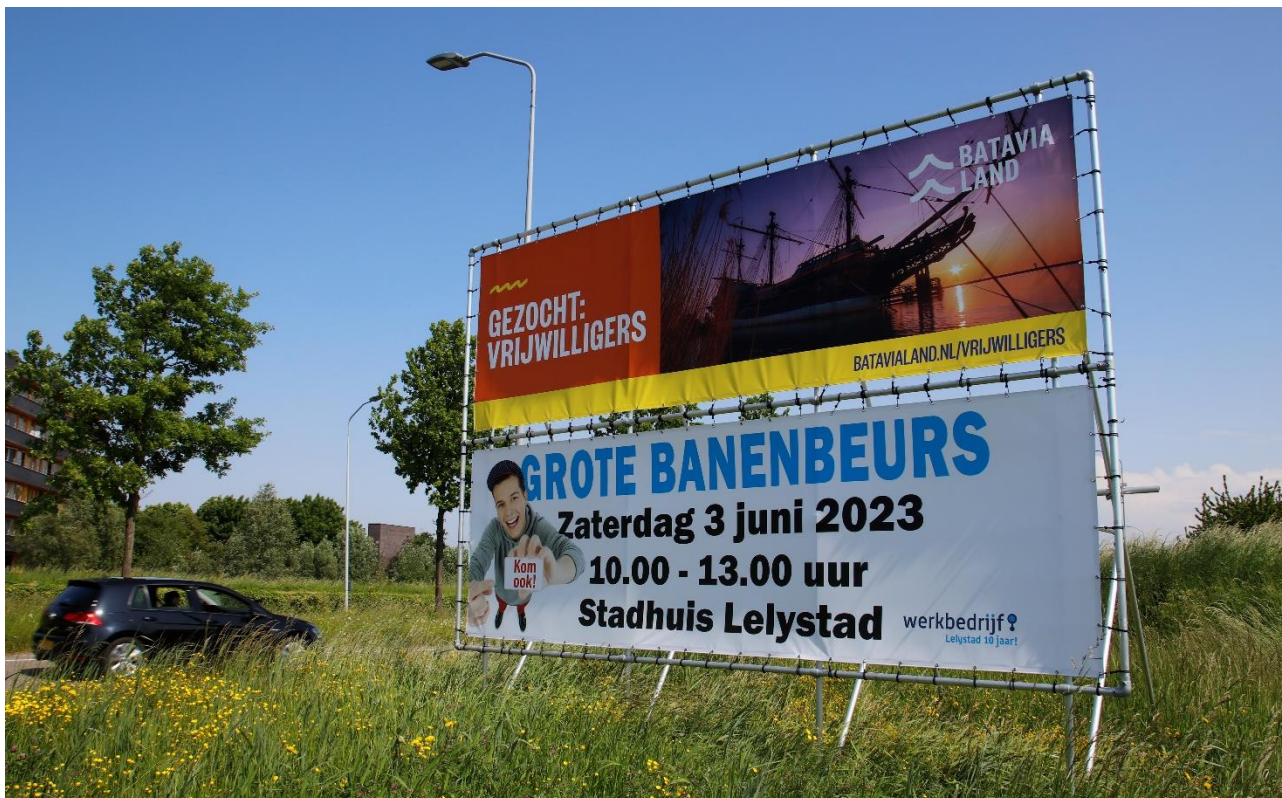
Foto: Op zaterdag 3 juni a.s. is er een grote banenmarkt in het stadhuis van Lelystad.